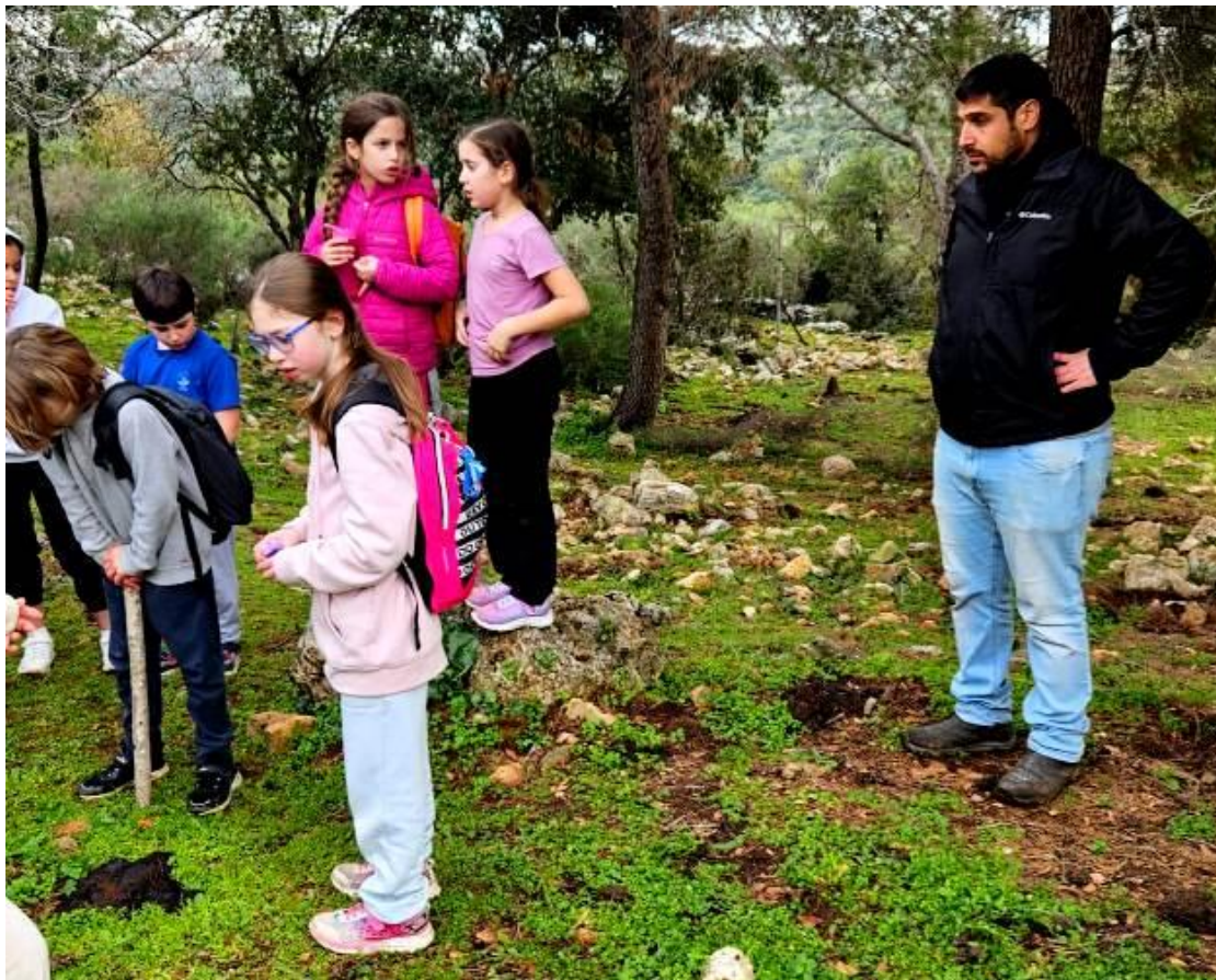
(המשך בעמ' 20)

התקיימו מגוון פעילויות לכבוד החג – יצירה ולימדה חוויתית על עצים. בימי שלישי הילדים יוצאים ל"צעדים בטבע" בטבע, לומדים להדליק מדורות, מבשלים ויוצרים יצירות.