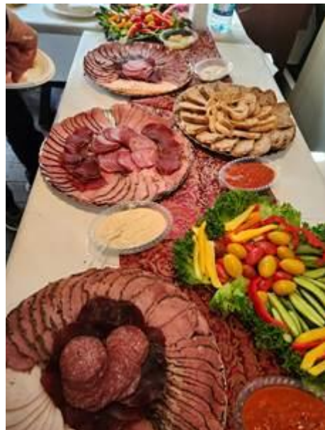
כל כך טעים