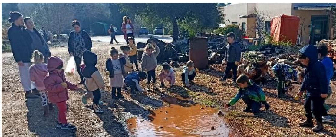
(המשך בעמ' 18)

סוף סוף, בסוף חודש ינואר, קיבלנו את האישור המיוחל ליציאה לטיולים ורק לאחרונה חזרו הילדים לטיולים כמו בעבר. את גן היער עדיין לא השמשנו, אבל כבר יצאנו לטיולים למבצר ולפיקניק.