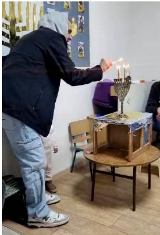
הדלקת נרות עם ההורים באנקור פשוש