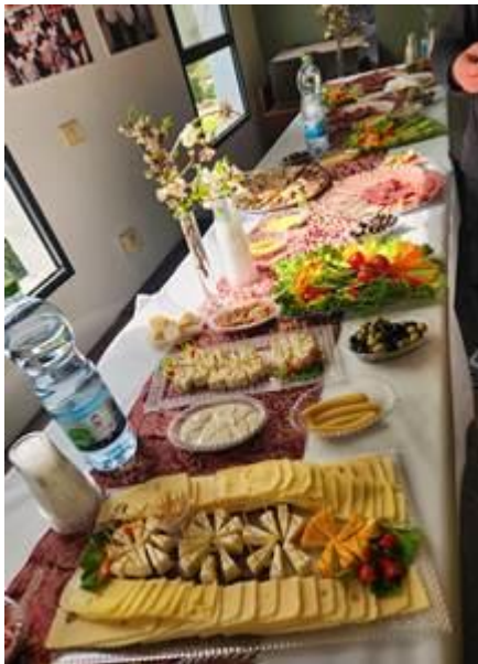
כל כך יפה