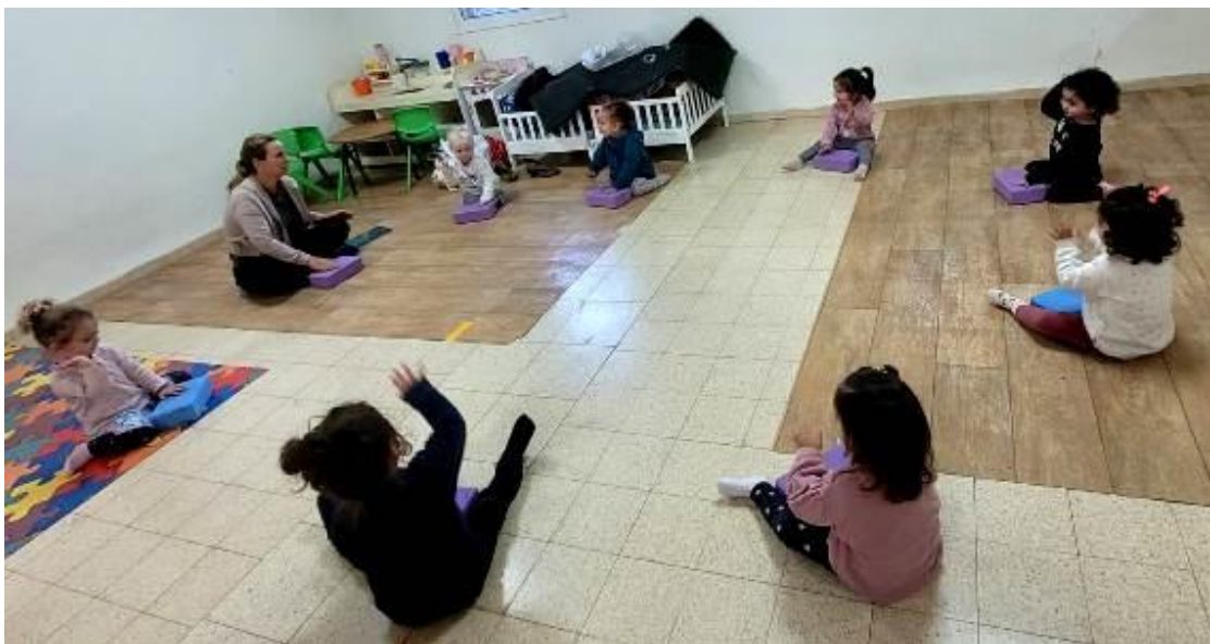
ילדי אנקור בשיעור תנועה במבנה בית התינוקות לשעבר

בשבוע שעבר קרס קיר בגן זמיר הן בשל הגשם והן בשל בניית הממד הצמוד אליו הנמצא בתהליכי בנייה מתקדמת. נאלצנו לשנע את כל ילדי הגיל הרך ממקום למקום.