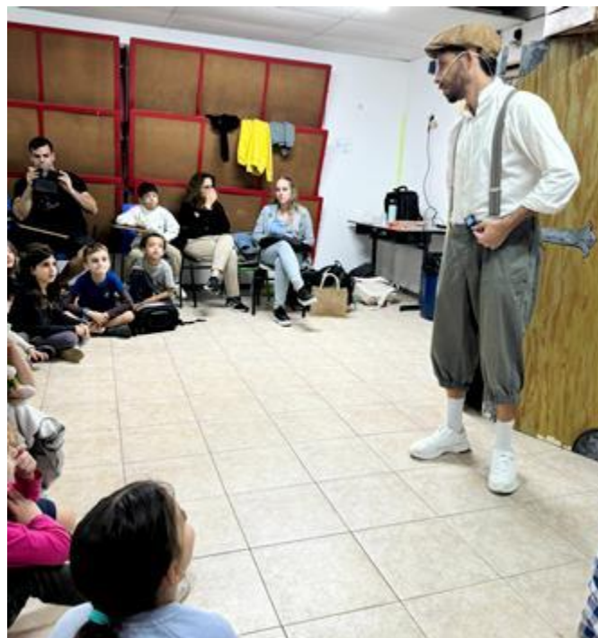
(המשך בעמ' 14)