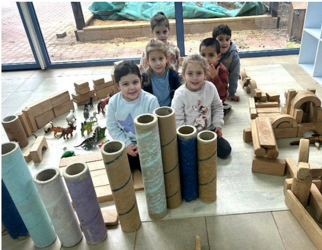
(המשך בעמ' 10)

עד התחלת התימרון בלבנון התנהלה מערכת החינוך הרך כרגיל. בחודש אוקטובר, עד אחרי סוכות מערכת הגיל הרך היתה סגורה. בראשית נובמבר פתחנו את הגנים. גן זמיר נפתח בלוח זמנים של יום מקוצר. לחדר הביטחון הוספנו דלת ברזל שאיפשרה לפיקוד העורף לאשר אותו כחדר ביטחון תקני. בד בבד החלה בניה של ממ"ד גדול, כתוספת לגן. את אנקור ופשוש איחדנו גם את הילדים וגם את חברות הצוות לפעילות של 5 ימים בשבוע. ילדי הגנון נכנסו בתחילת המלחמה לגן דרור לשעבר (מבנה המתנס), שבו יש כמובן מרחב מוגן תקני.