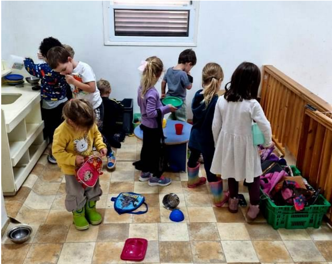
ילדי גן זמיר מתפנים

בשבוע שעבר קרס קיר בגן זמיר הן בשל הגשם והן בשל בניית הממד הצמוד אליו הנמצא בתהליכי בנייה מתקדמת. נאלצנו לשנע את כל ילדי הגיל הרך ממקום למקום.