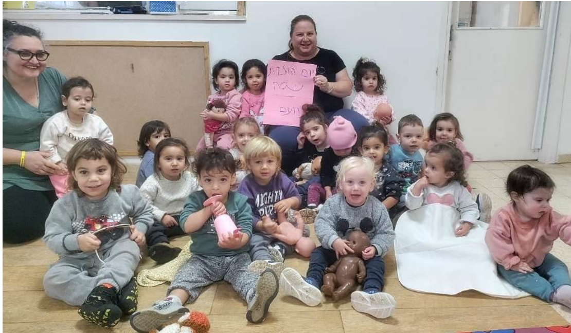
ילדי אנקור מברכים את הקיבוץ ליומולדת 78

ילדי גן זמיר עברו למבנה המתנס והקטנים עברו לגן עפרוני (בית התינוקות לשעבר). כרגע עובדים על הפרדת בית התינוקות לשני מרחבים עבור שתי הקבוצות, אנקור ופשוש.