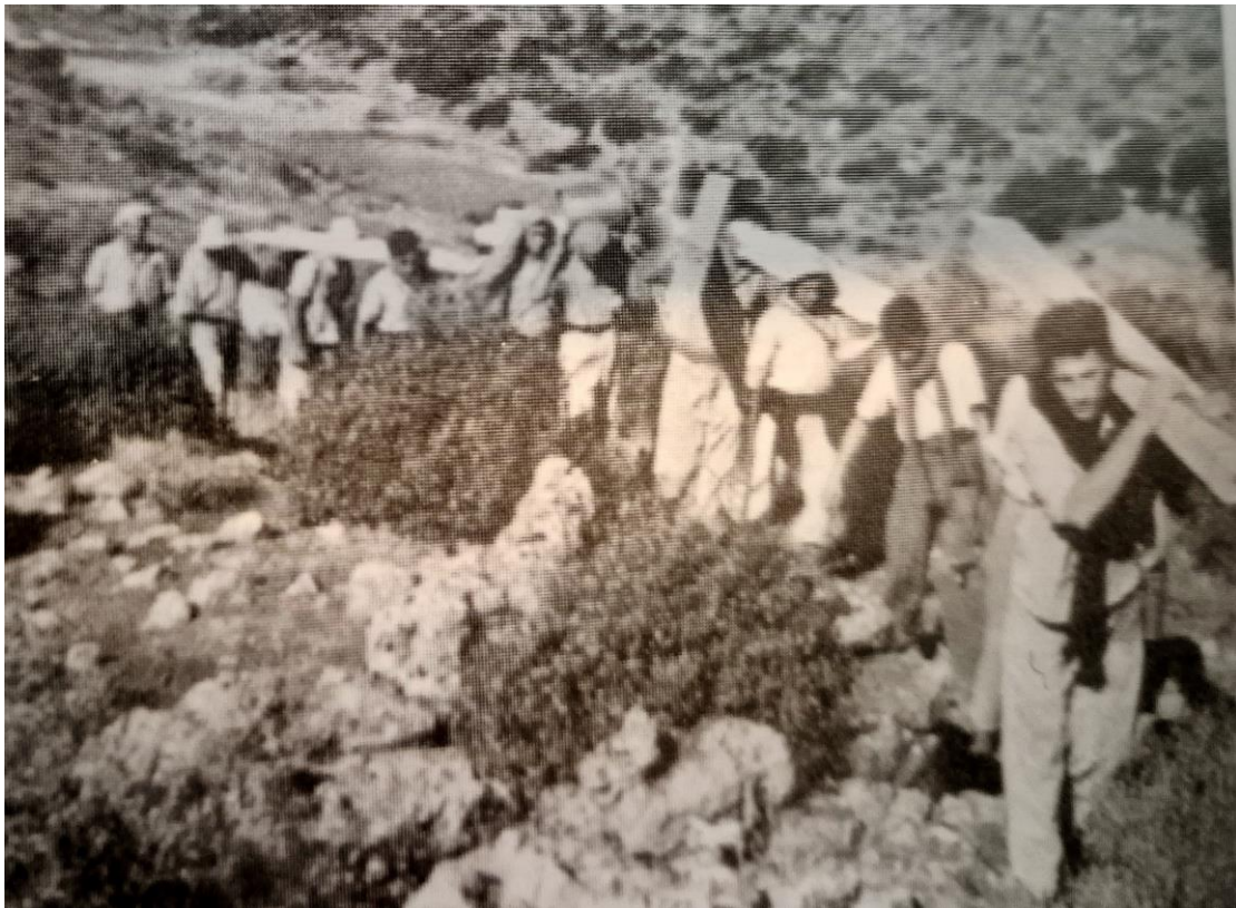
יום העלייה. חלוצי הקיבוץ נושאים על כתפיהם את הציוד לנקודה